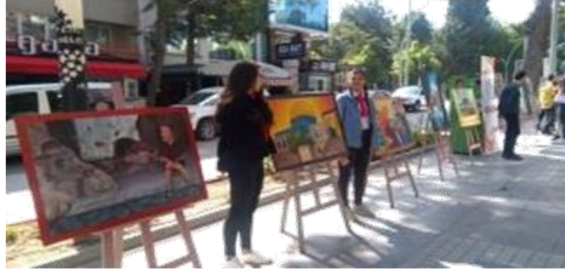
Okulumuz öğrencileri tarafından Kudüs konulu resim sergisi açıldı